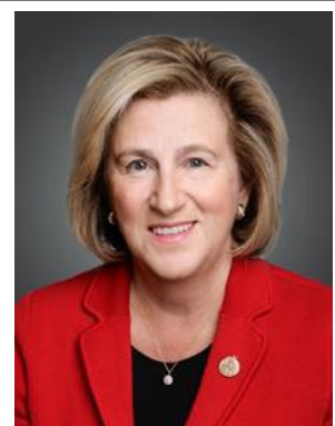
L'honorable Helena Jaczek Ministre responsable de l'Agence fédérale de développement économique pour le Sud de l'Ontario.

L'Agence continue de soutenir les entreprises qui favorisent une croissance propre et inclusive afin de créer des emplois et de nouveaux produits et services à caractère innovant dans la région. FedDev Ontario a effectué des investissements stratégiques dans de nombreux secteurs, notamment en innovation dans le domaine de la santé, en technologie, dans l'industrie manufacturière, en tourisme et en soutien aux groupes sous-représentés. L'Agence a continué de respecter son engagement à favoriser une économie résiliente, dynamique et croissante qui génère des emplois, des possibilités et une meilleure qualité de vie pour tous les Canadiens et Canadiennes, y compris ceux issus de milieux particuliers, comme les femmes, les Autochtones, les Noirs et les autres groupes racisés, les jeunes, les LGBTQ2 et d'autres.