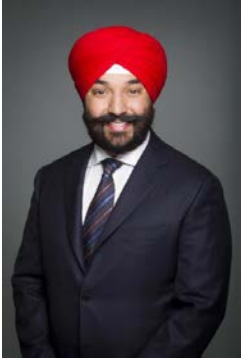
L'Honorable Navdeep Bains Ministre de l'Innovation, des Sciences et du Développement économique